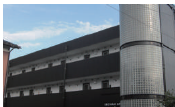
千葉県市川市 集合住宅 3階建 大規模修繕工事