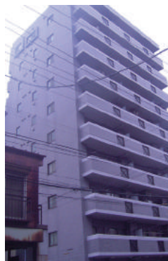
神奈川県横浜市南区 集合住宅 10階建 大規模修繕工事