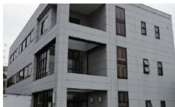
神奈川県伊勢原市高森 工場 3階建 大規模修繕工事