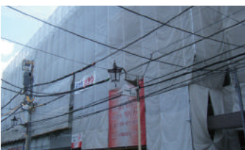
神奈川県横浜市保土ヶ谷区 集合住宅 5階建 大規模修繕工事