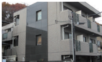
神奈川県 横浜市緑区 集合住宅 3階建 大規模修繕工事