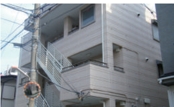
神奈川県横浜市港北区 集合住宅 3階建 大規模修繕工事