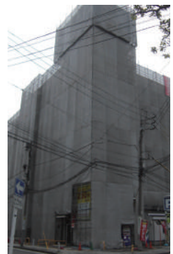
神奈川県横浜市中区 立体駐車場 7階建 大規模修繕工事