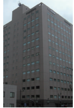
2016年竣工 神奈川県横浜市中区 オフィスビル 14階建 鉄部塗装工事