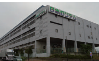
神奈川県伊勢原市高森 工場 3階建 大規模修繕工事