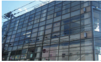
2017年竣工 神奈川県横浜市旭区 店舗ビル 4階建 大規模修繕工事