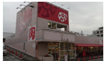
神奈川県伊勢原市高森 店舗ビル 3階建 大規模修繕工事 3