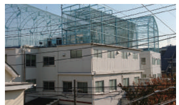
東京都大田区 工場 3階建 大規模修繕工事