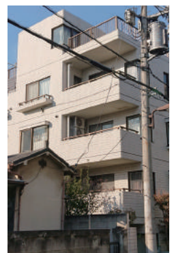
東京都目黒区 集合住宅 5階建 大規模修繕工事