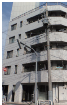
東京都江東区 集合住宅 5階建 大規模修繕工事