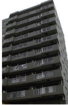
2017年竣工 東京都江東区 集合住宅 大規模修繕工事