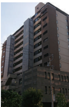
東京都千代田区 オフィスビル・集合住宅 12階建 大規模修繕工事