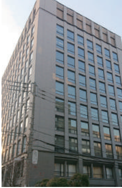
2018年竣工 東京都千代田区 オフィスビル 11階建 大規模修繕工事