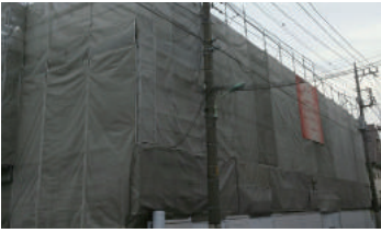
2018年竣工 埼玉県川口市 工場 3階建 大規模修繕工事