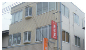
神奈川県横浜市戸塚区 店舗ビル 3階建 大規模修繕工事